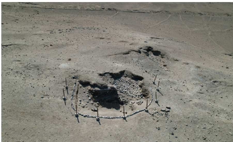
Sitio Camarones. Cultura Chinchorro.

La conservación de cualquier tipo de resto dependerá de cómo reaccione con el entorno en donde se deposita. La abundancia de restos que encontramos hoy en el norte de Chile se debe a que tanto la sequedad del clima como la salinidad de los suelos actúan como preservantes de muchos tipos diferentes de materialidades. Para el caso del sur, tanto la humedad como la acidez de los suelos es capaz de deteriorar y descomponer muchos tipos de materiales de origen orgánico, como restos vegetales, óseos animales y humanos, etc.; es importante comprender que las condiciones en que se conservan los restos no dependen únicamente de los factores nombrados, sino que son un conjunto de condiciones que interactúan generando la preservación o descomposición de cada tipo de material.