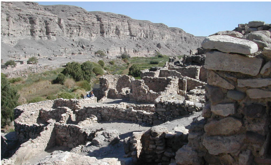
Foto: Pukará de Lasana, Calama, Antofagasta

En Chile los sitios y piezas arqueológicas están protegidos por la Ley 17.288 de Monumentos Nacionales, la cual establece que todos ellos son propiedad del Estado y deben ser conservados. Es decir, por el solo hecho de existir son Patrimonio Nacional protegido, o sea no necesitan ser encontrados y registrados, y tampoco de un decreto específico para ser considerados Monumentos Nacionales (Ley 17.288, Art. 21 a ).