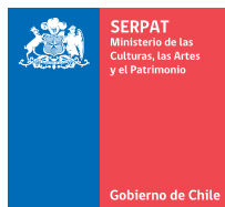
Icono institucional actual