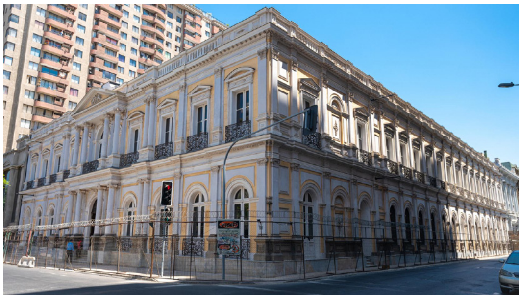
Monumento Histórico Palacio Pereira, sede del Consejo de Monumentos Nacionales desde 2022

El Consejo de Monumentos Nacionales, ha tenido tres grandes locaciones donde ha desempeñado funciones. La primera corresponde a la Biblioteca Nacional, hasta inicios de los años 2000. Luego se trasladó a la Casa de las Gárgolas hasta finales del 2022 y en la actualidad, su sede central se ubica en el Palacio Pereira, comuna de Santiago, Región Metropolitana.