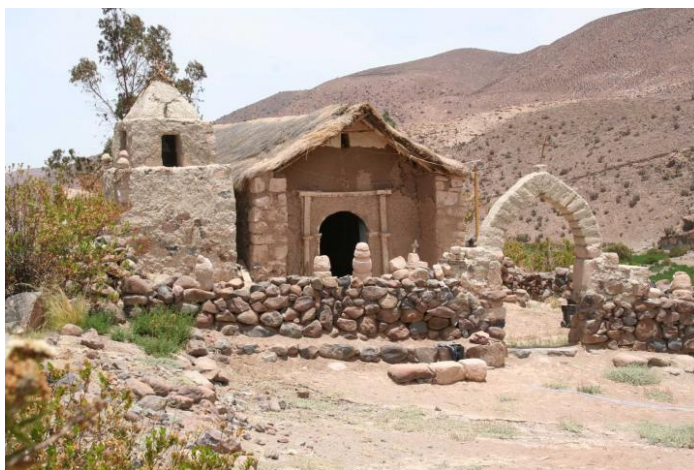
Iglesia San Antonio de Padua de Sucuna

La Comisión de Patrimonio Histórico tramita además las declaratorias de MH con carácter conmemorativo, como son los Sitios de Memoria. Los cuales son bienes que poseen un valor no asociado a su condición material, por ejemplo, los espacios ligados a la memoria de las violaciones a los derechos humanos que ocurrieron durante la Dictadura Civil Militar.