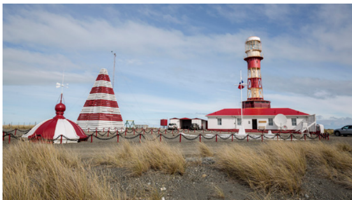
Monumentos Histórico Faro Dungeness

Existen los Monumentos Históricos inmuebles, que son edificios, lugares, ruinas, entre otros. y los Monumentos Históricos Muebles, que pueden ser objetos de cualquier propiedad, que deben ser protegidos y declarados, como es el caso de las colecciones de los Museos del Servicio Nacional del Patrimonio.