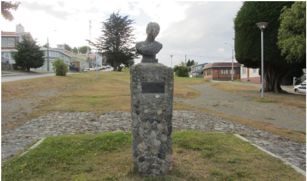
Monumento público a Alfonsina Storni

Puedes revisar el 1er Estudio de Monumentos Públicos a Mujeres en Capitales Regionales en www.monumentos.gob.cl/