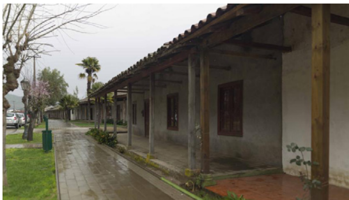
Zona típica Centro Histórico de Lolol

Una Zona Típica (ZT) es una de las seis categorías de Monumento Nacional y se trata de agrupaciones de bienes inmuebles urbanos o rurales, que constituyen una unidad de asentamiento representativo de la evolución de la comunidad humana, y que destacan por su unidad estilística, su materialidad o técnicas constructivas. En un principio, éstas se crearon como una forma de proteger el entorno de algún Monumento Histórico y/o Arqueológico, pero luego y hasta la actualidad, las Zonas Típicas son un gran recurso para la protección de las particularidades y valores del conjunto de inmuebles.