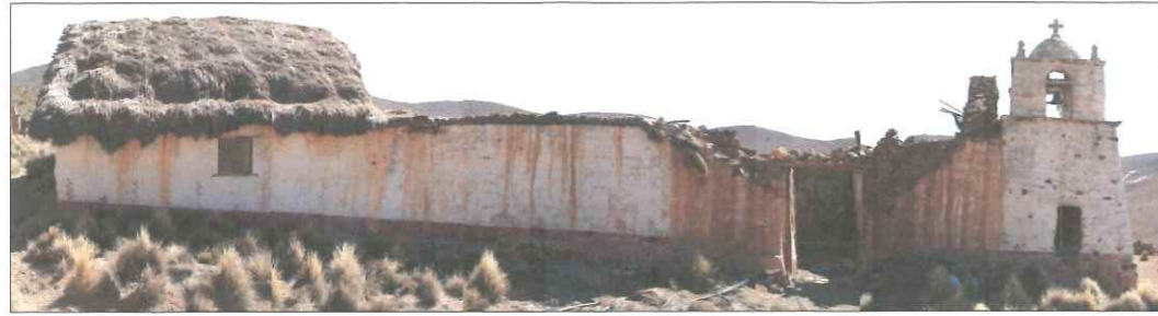
Vista oriente de la Iglesia Virgen Asunta de Choquelimpie