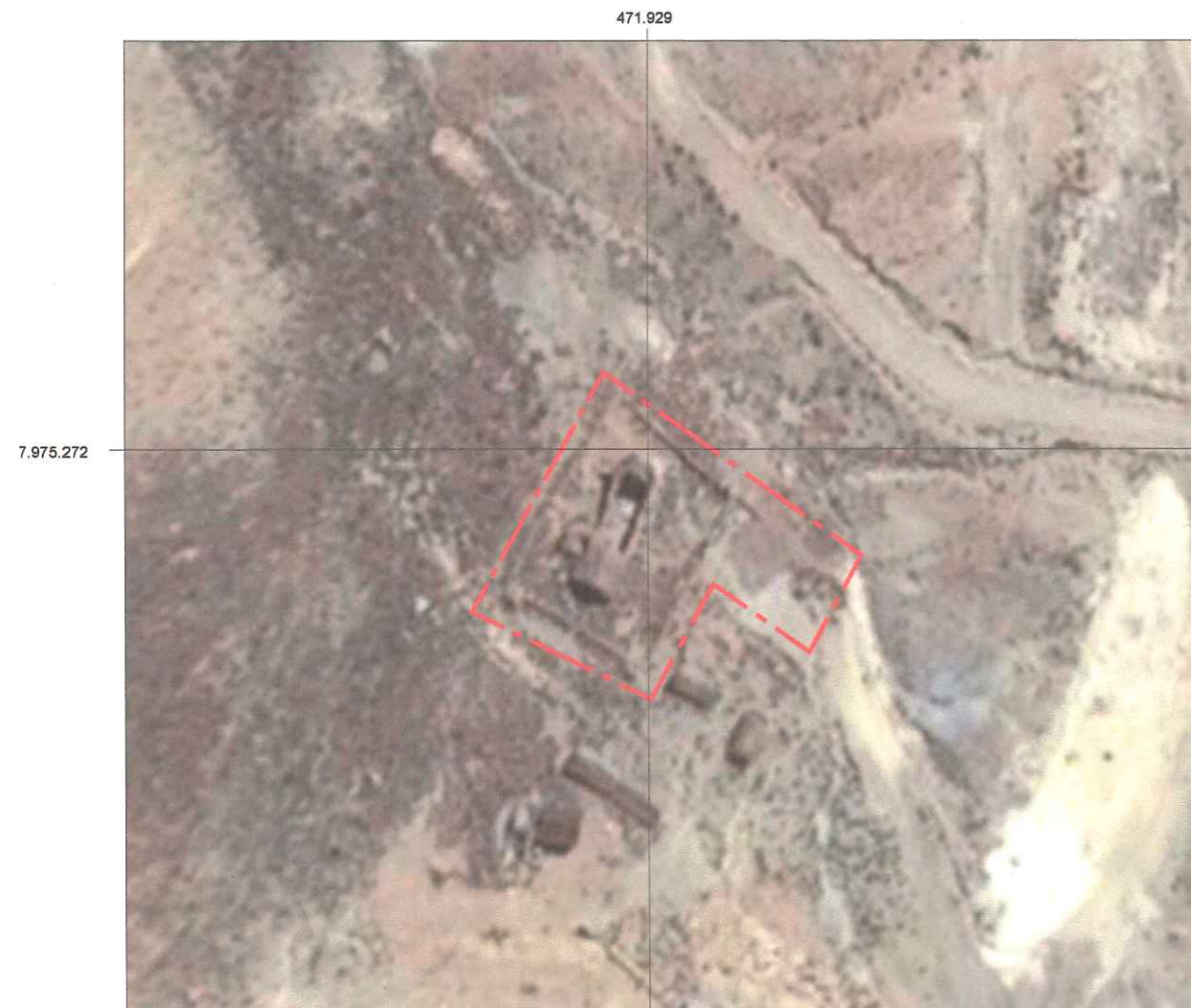
PLANO DE UBICACIÓN ESCALA GRÁFICA