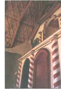
Vista interior de la Iglesia Virgen Asunta de Choquelimpie