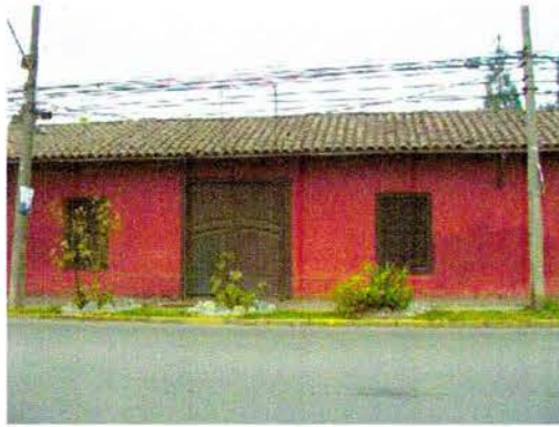
Fachada poniente, acceso por avenida El Guanaco