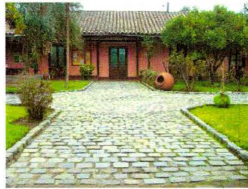
Vista del patio central desde el acceso sur a la casona