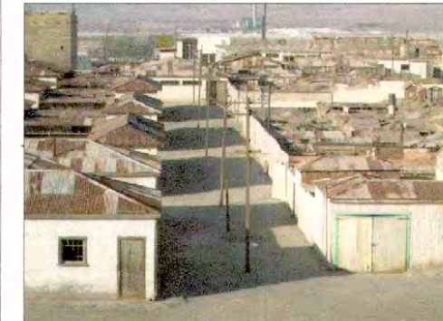
Campamento, Oficina Humberstone