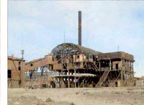
Planta de Lixiviación, Oficina Santa Laura