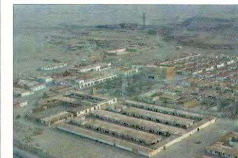
Vista Aérea Campamento, Oficina Humberstone