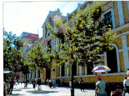
Vista acceso por Avenida Libertador Bernardo O'Higgins