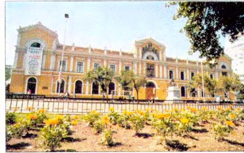
Vista fachada principal