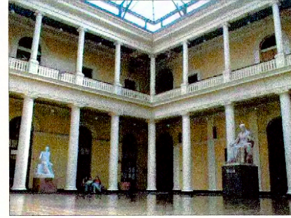
Vista patio interior