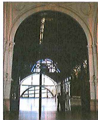
Interior de Estación