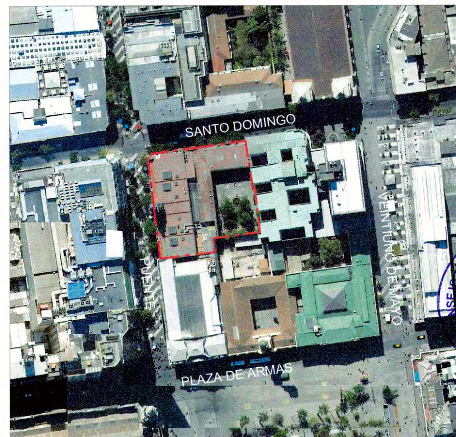
PLANO DE UBICACIÓN SIN ESCALA

NOTAS: Plano elaborado en el Consejo de Monumentos Nacionales en base a: Base catastral I Municipalidad de Santiago. Levantamiento GPS Datum WGS 84, Huso 19 S. El edificio se entiende como una unidad por lo tanto el polígono de protección incluye todo elemento saliente que forma parte de su configuración arquitectónica. Las cotas prevalecen por sobre el dibujo, son aproximadas y están expresadas en metros, en caso de fondos de predio, estos prevalecen por sobre la cota. (*) Esta información no acredita propiedad