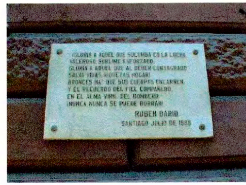
Detalle de placa en acceso principal