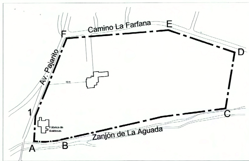
LÍMITE DECLARADO DE N° 325 27/7/1994