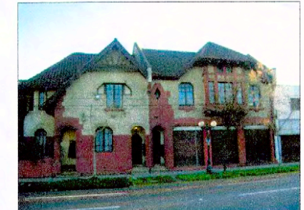
Fachada calle Eleodoro Yáñez