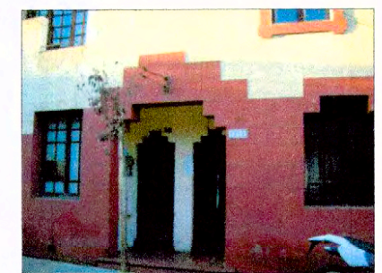
Zócalo rojo que demarca puertas y ventanas