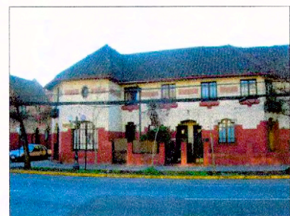
Fachada calle Manuel Montt