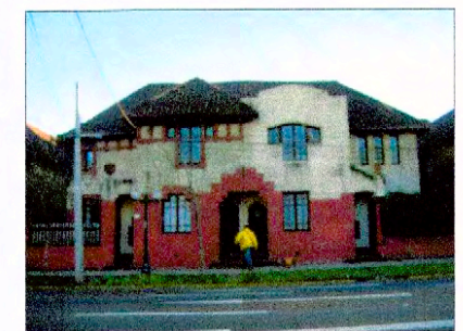
Fachada calle Eleodoro Yáñez