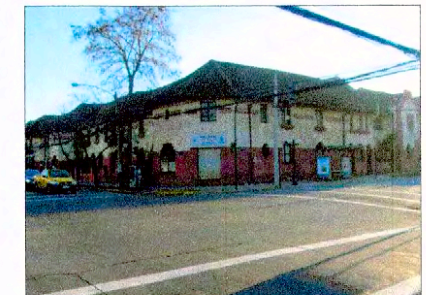
Intersección Manuel Montt y Eleodoro Yáñez