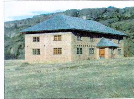
ELEVACIÓN PONIENTE - NORTE