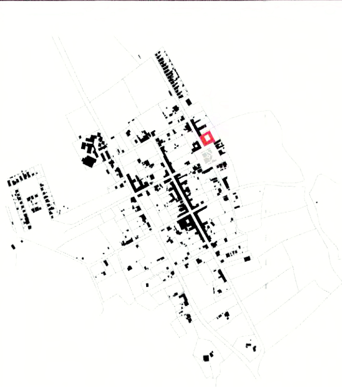
PLANO DE LA LOCALIDAD