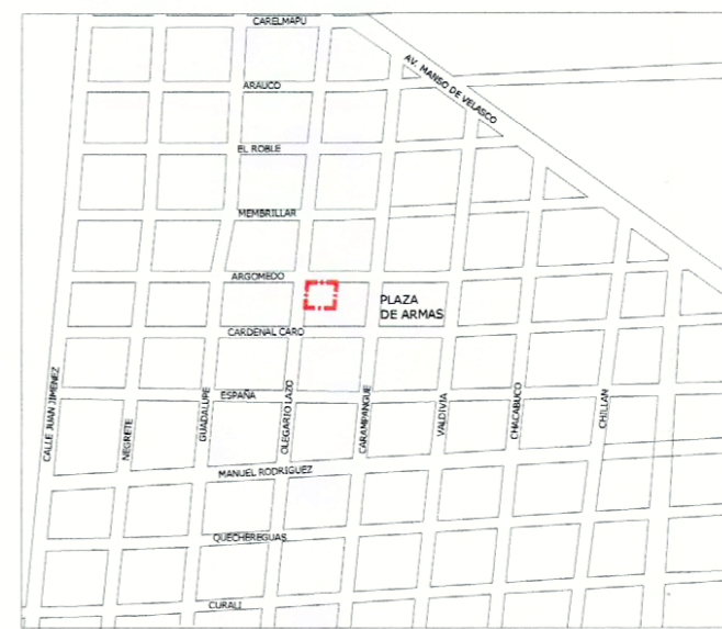
PLANO DE UBICACIÓN SIN ESCALA