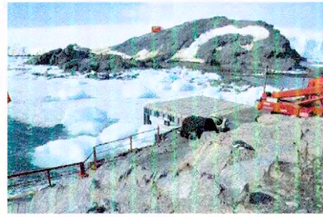
Embarcadero Base Militar Bernardo O'Higgins