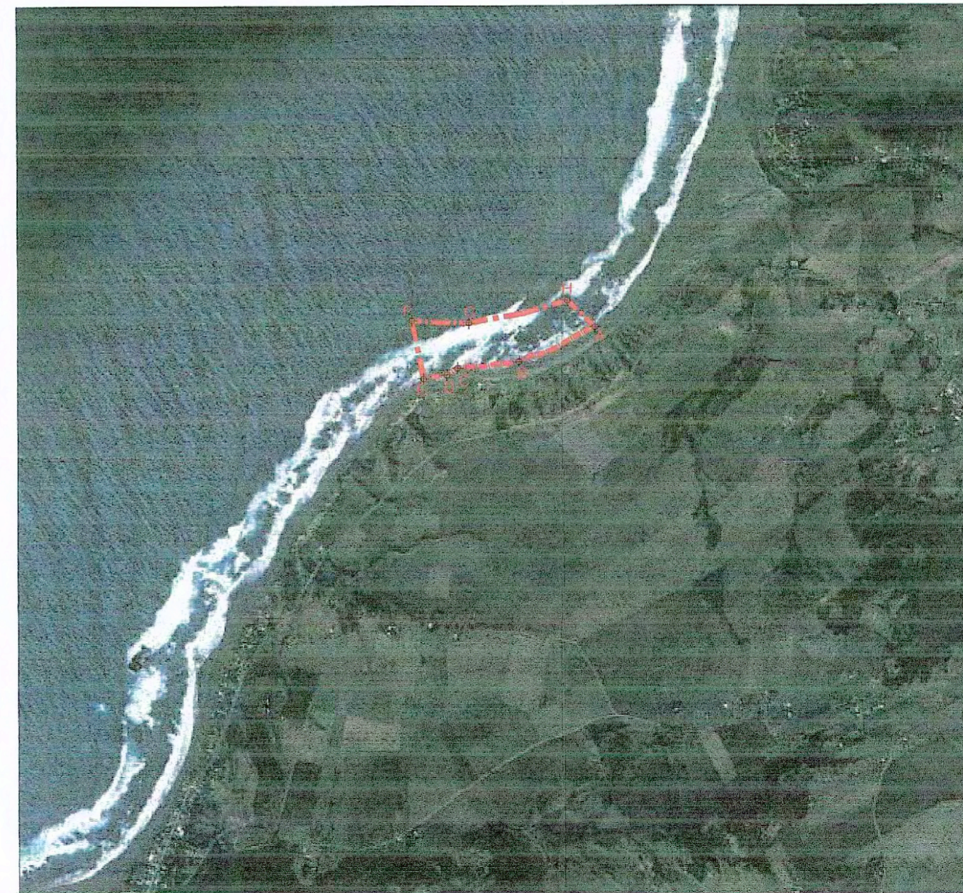
IMAGEN GOOGLE DE UBICACIÓN ESCALA APROXIMADA 1 : 17.000

NOTA: Plano elaborado en el Consejo de Monumentos Nacionales en base a: