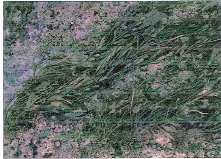
Alga Calabacillo ( Macrosystis Pyrifera )