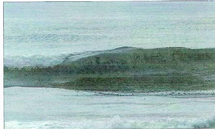
Vista del SN desde la Playa