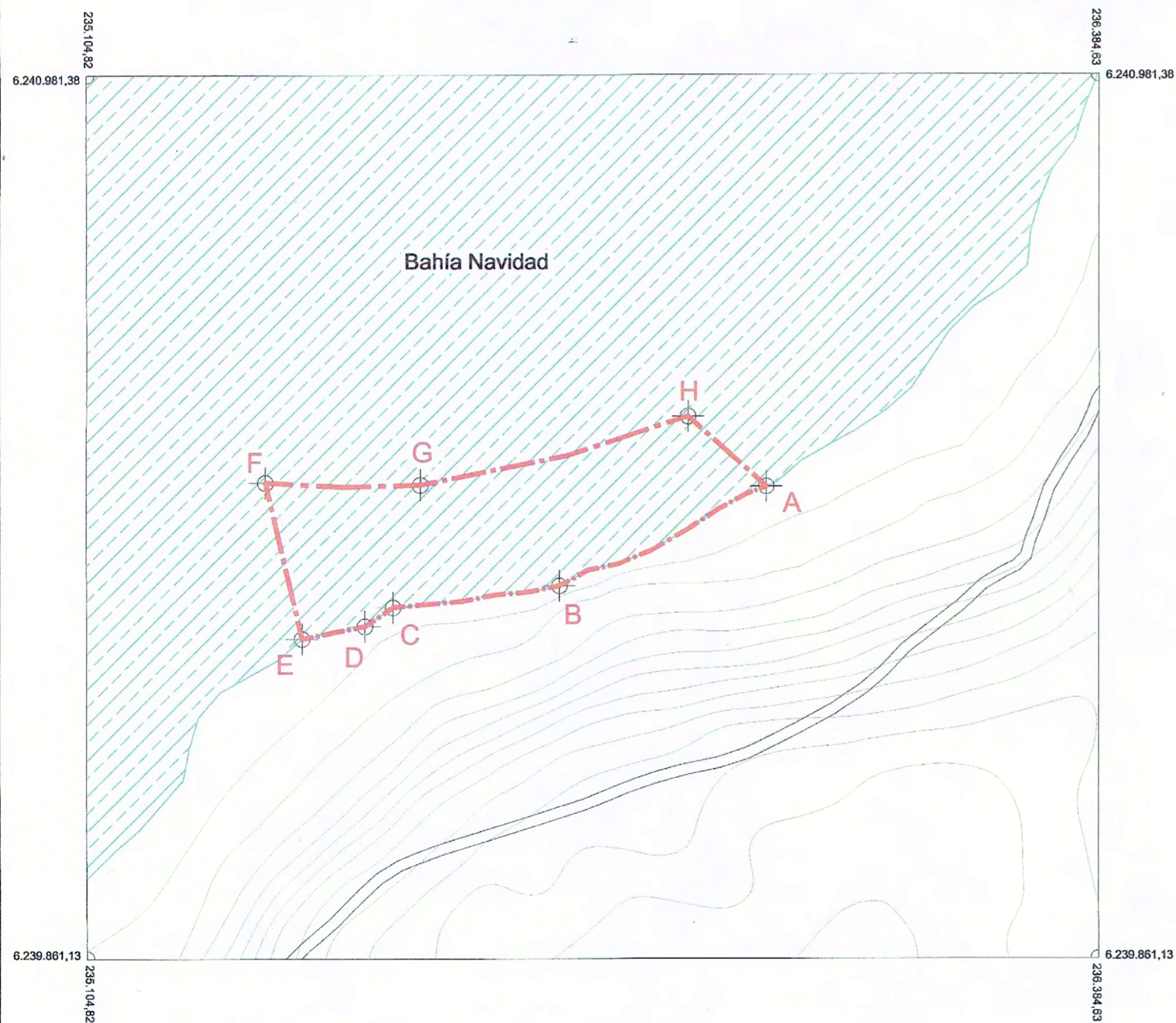
PLANO DE UBICACIÓN ESCALA GRÁFICA