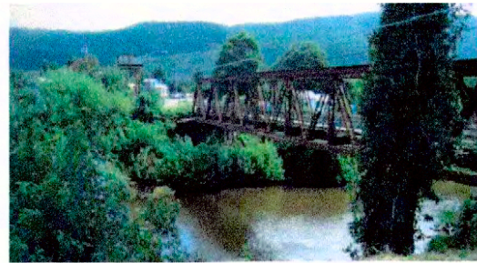
Vista del Puente de Collilelfu