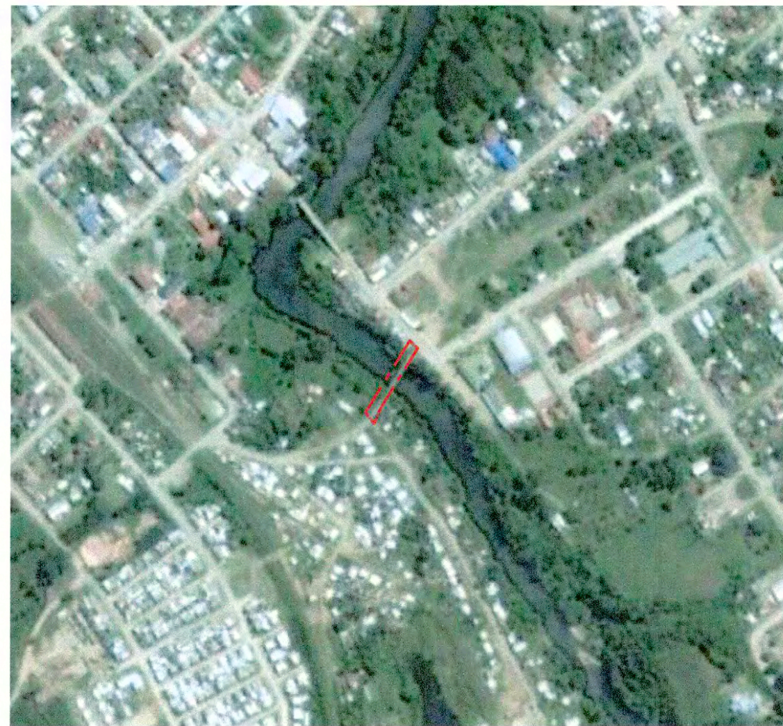
PLANO DE UBICACIÓN EN BASE A FOTO GOOGLE EARTH SIN ESCALA