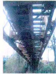
Vista del Puente de Collilelfu