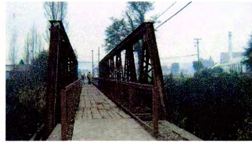
Vista del Puente de Collilelfu