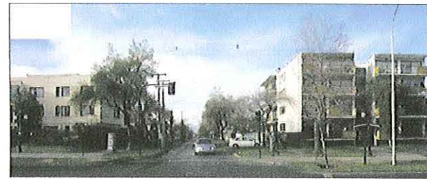
Vista Avenida Pocuro esquina calle Las Amapolas