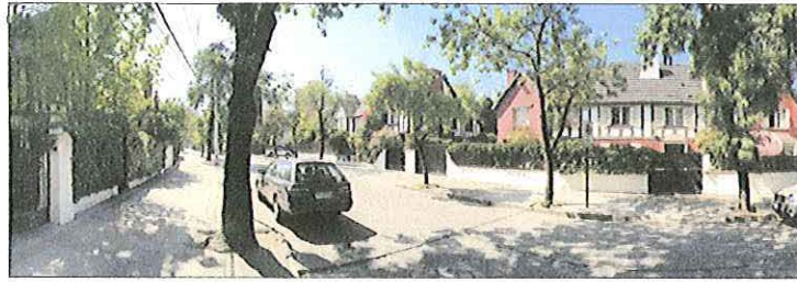
Vista calle Interior