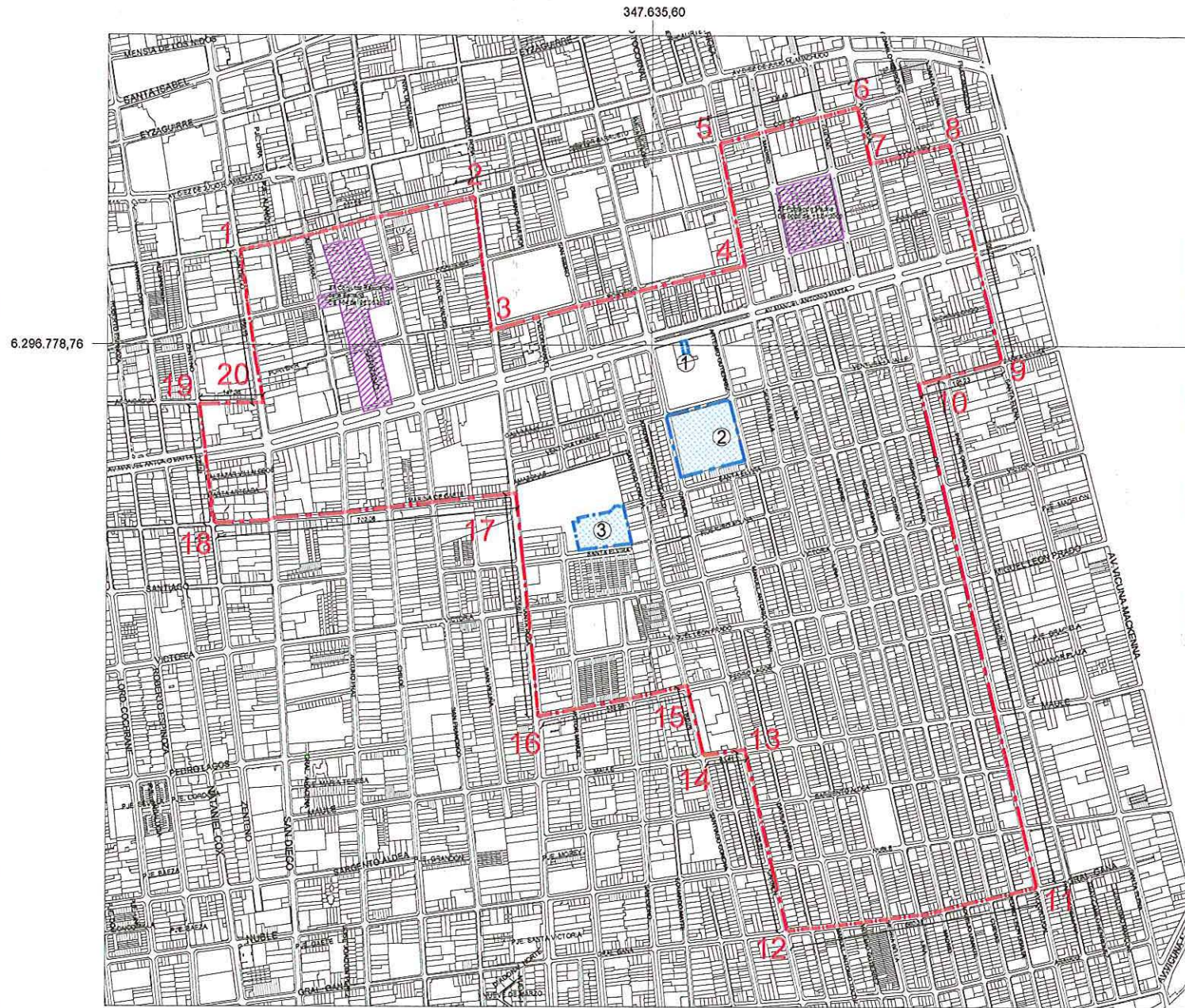
PLANO DE LÍMITES ESCALA GRÁFICA