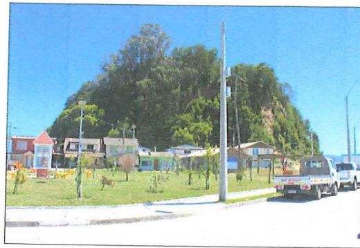
Fotografías Fuerte el Morro