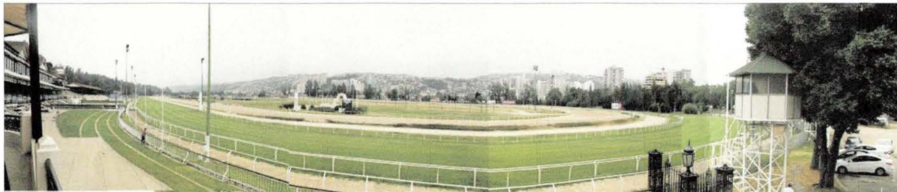
Vista panorámica hacia pistas de césped y tierra