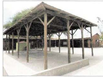
Fotografía del interior del Liceo de Huara