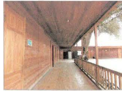
Fotografía del pasillo del Liceo de Huara