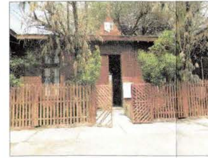
Fotografía de la fachada principal del Liceo de Huara