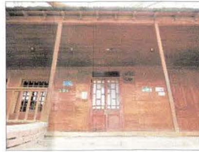
Fotografía de la fachada del Liceo de Huara