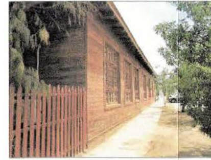
Fotografía de la fachada del Liceo de Huara