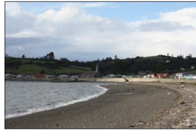
Vista hacia la Iglesia desde el humedal.