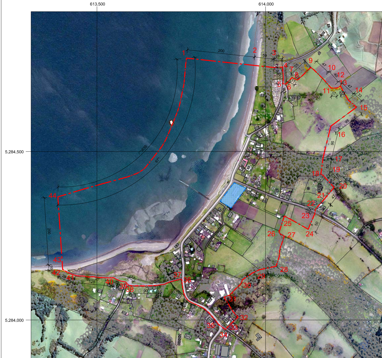
PLANO DE LÍMITES ESCALA GRÁFICA