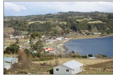
Vista desde el cementerio hacia el pueblo.