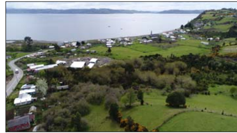
Vista hacia el pueblo y el mar.