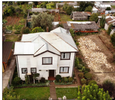
Vista aérea de la fachada principal del inmueble