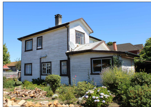
Vista de la fachada suroriental del inmueble