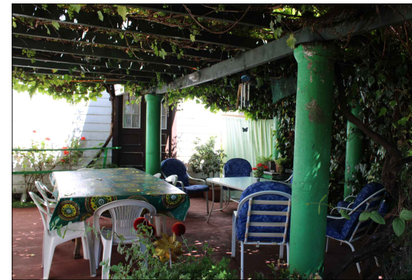
Vista del patio parrón