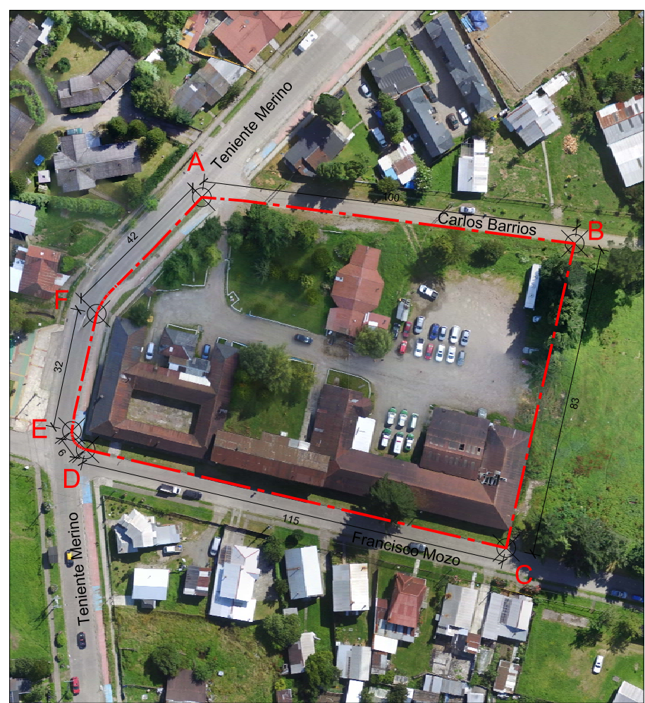
PLANO DE LÍMITES ESCALA GRÁFICA