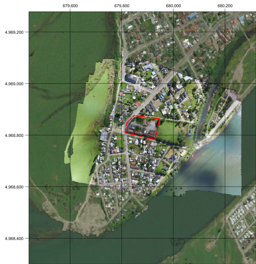
PLANO DE UBICACIÓN ESCALA GRÁFICA