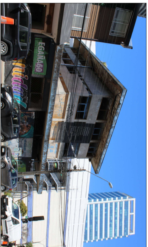
Vista de la fachada norte del inmueble