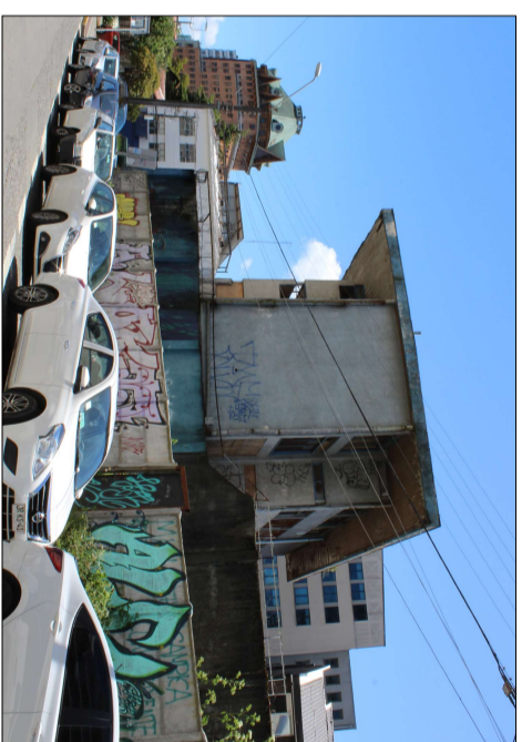
Vista de la fachada sur del inmueble