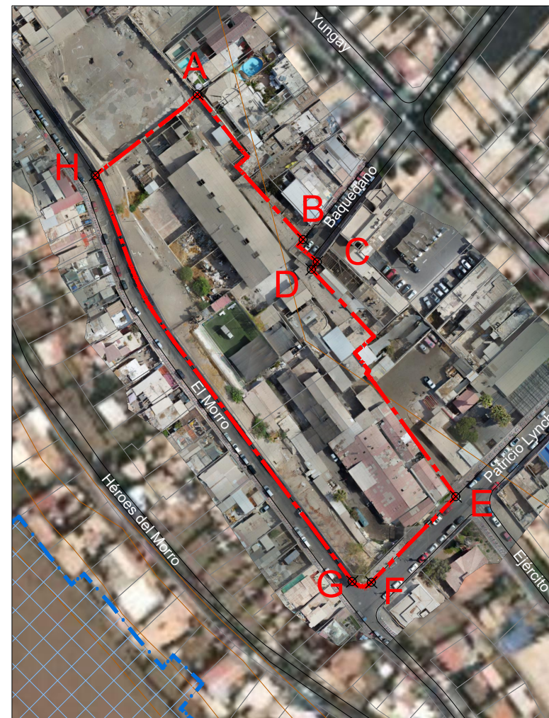
PLANO DE LÍMITES ESCALA GRÁFICA