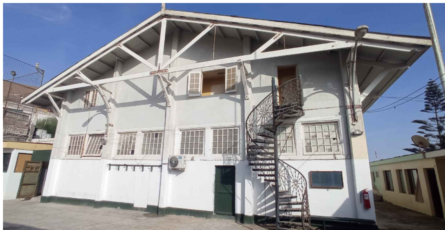
Vista general inmueble principal habilitado con celdas - dormitorio