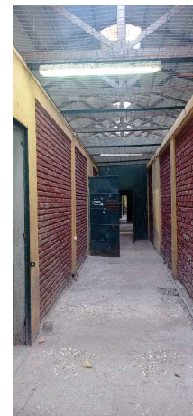
Pasillo y celdas