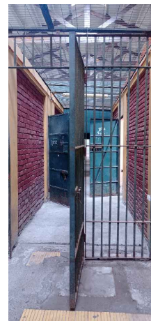
Pasillo y celdas