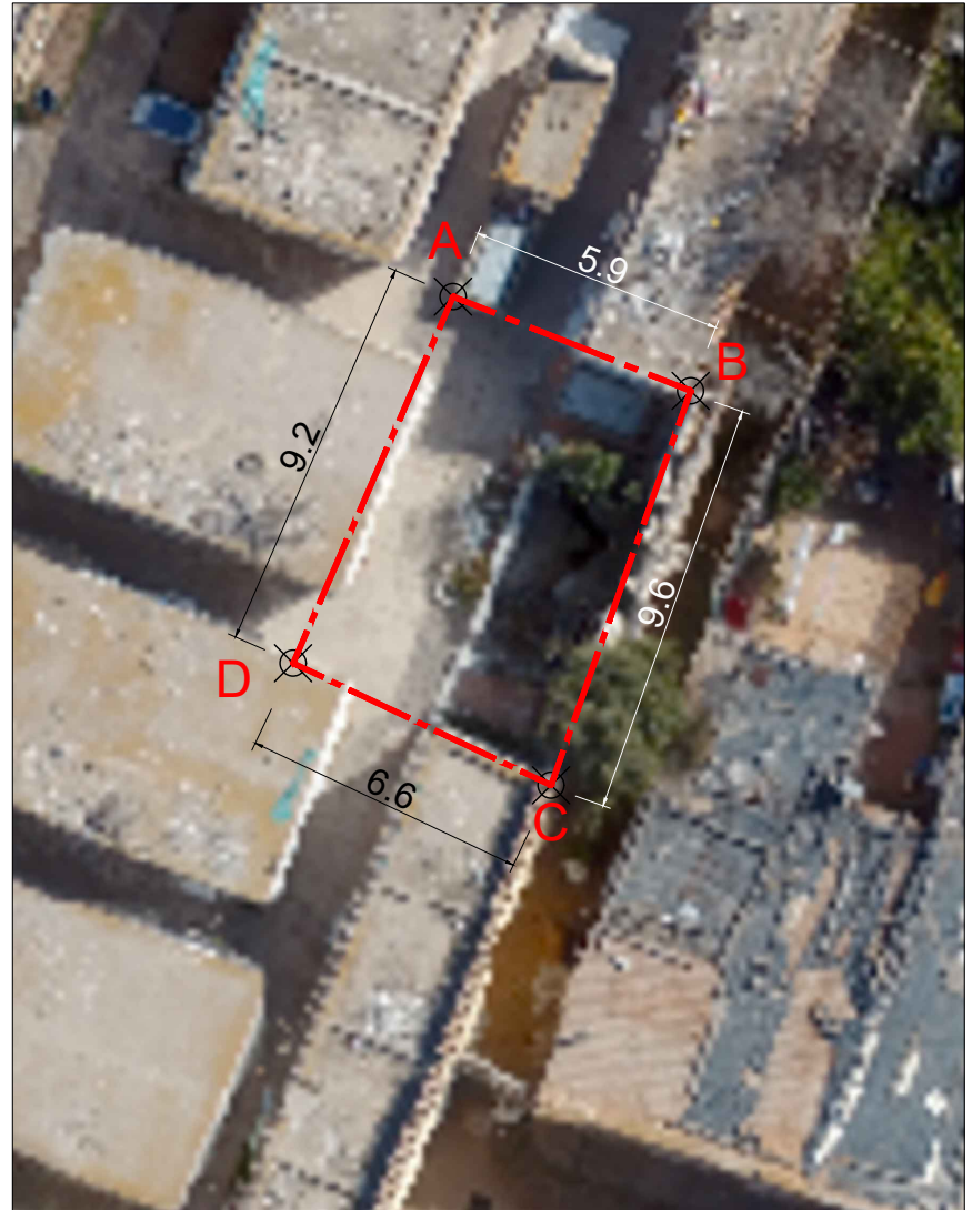
PLANO DE LÍMITES ESCALA GRÁFICA