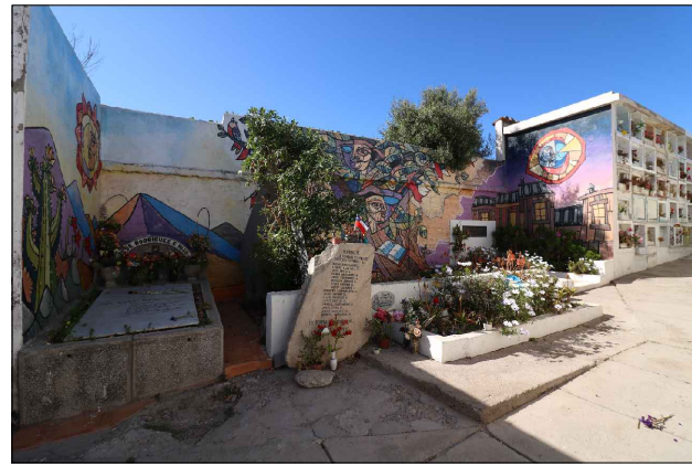
Vista Norponiente de la Fosa