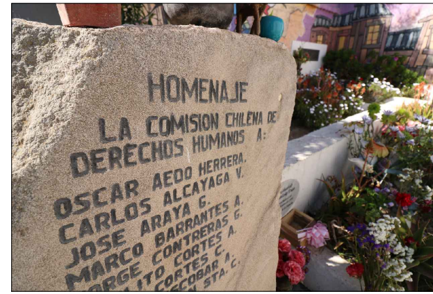
Detalle de memorial