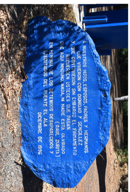
Piedra granítica con texto escrito por Raúl Zurita.