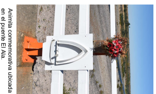
Animita conmemorativa ubicada en el puente El Ala.