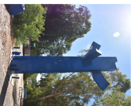
Memorial Puente El Ala.