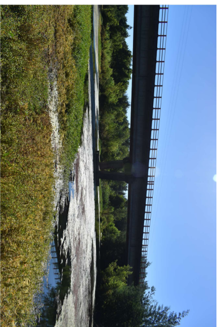
Vista desde ribera hacia nuevo puente El Ala.