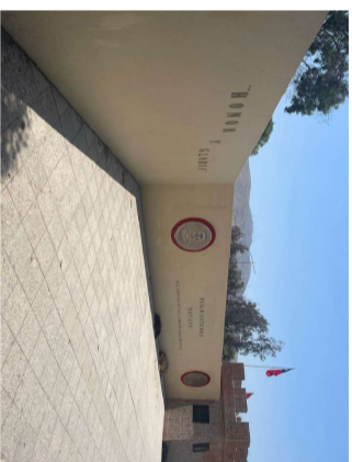
Acceso al Regimiento