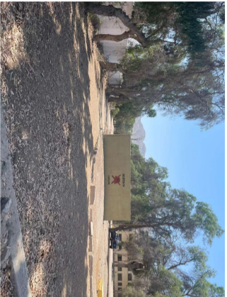
Interior del Regimiento