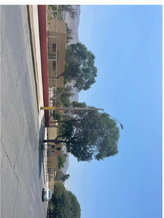
Vista panorámica del Ingreso al Regimiento