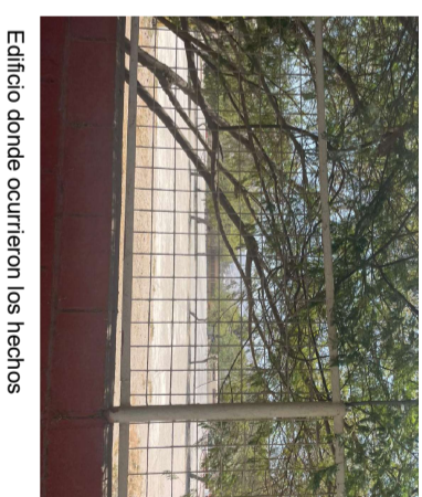
Edificio donde ocurrieron los hechos