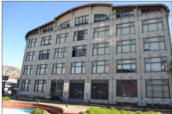
Vista fachada de U. de Valparaíso - Facultad de Ingeniería.