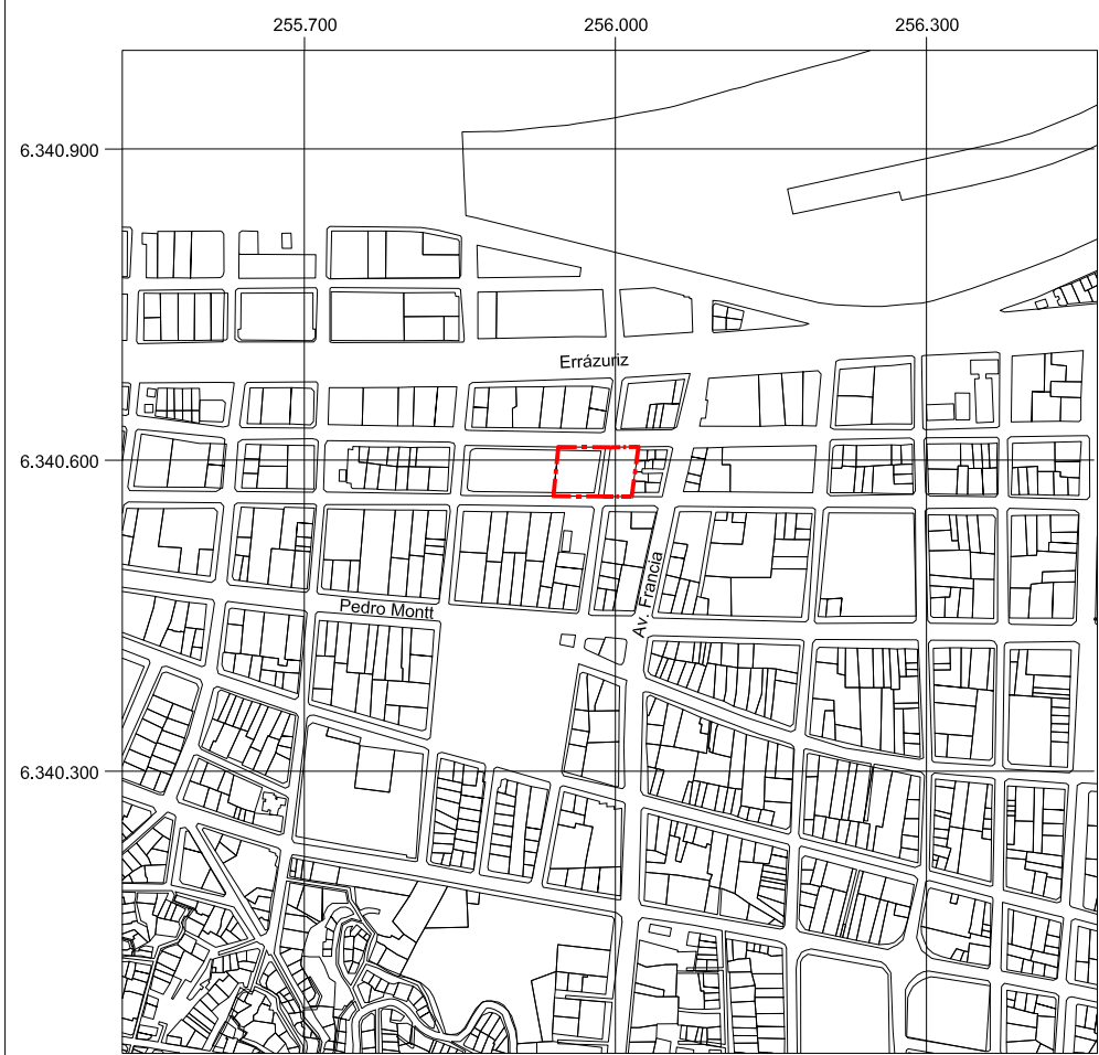
PLANO DE UBICACIÓN ESCALA GRÁFICA