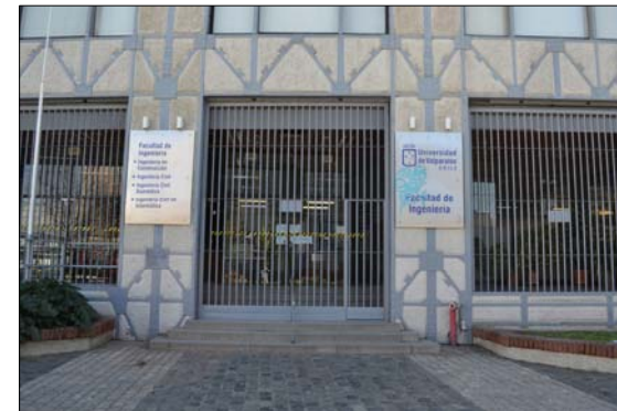
Vista fachada de U. de Valparaíso - Facultad de Ingeniería.