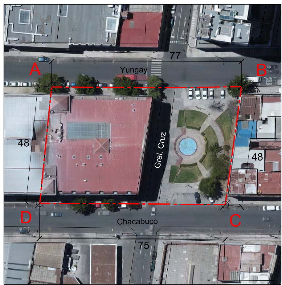
PLANO DE LÍMITES ESCALA GRÁFICA