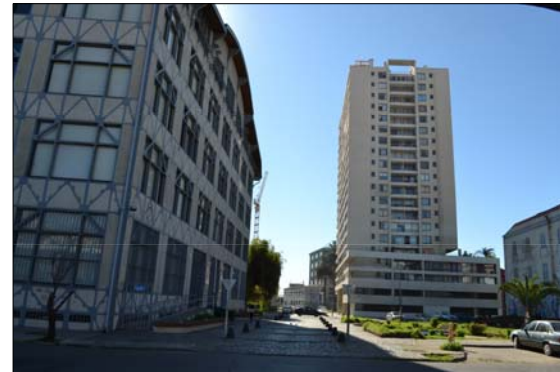
Vista general de U. de Valparaíso y plazoleta.