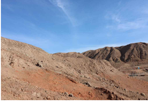
Vista General Sector Quebrada El Way - Formación Coloso.