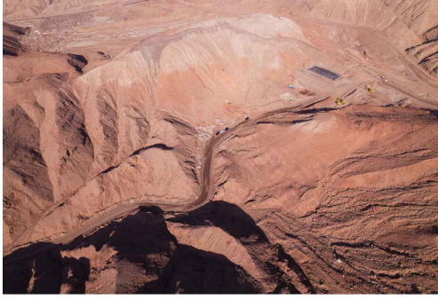
Vista aérea Sector Quebrada el Way Vuelo drone, 2025.