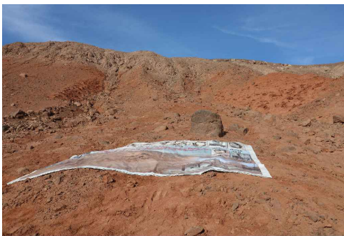
Roca ígnea considerada un atributo, al constituir un elemento natural utilizado por los familiares como punto de orientación en el sector