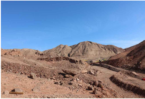
Camino que utilizó la Caravana de la Muerte para el traslado de los prisioneros a Quebrada El Way.