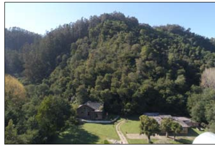
Vista panorámica del entorno de Planta Hidroeléctrica de Chivilingo