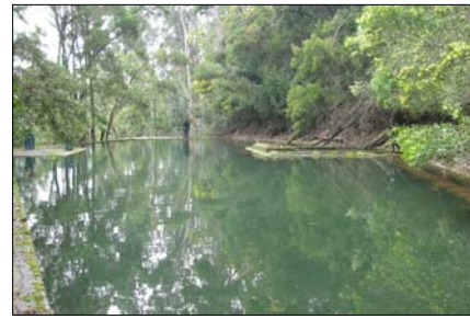
Vista estanque acumulador de agua