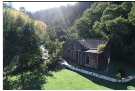
Vista de Planta Hidroeléctrica de Chivilingo